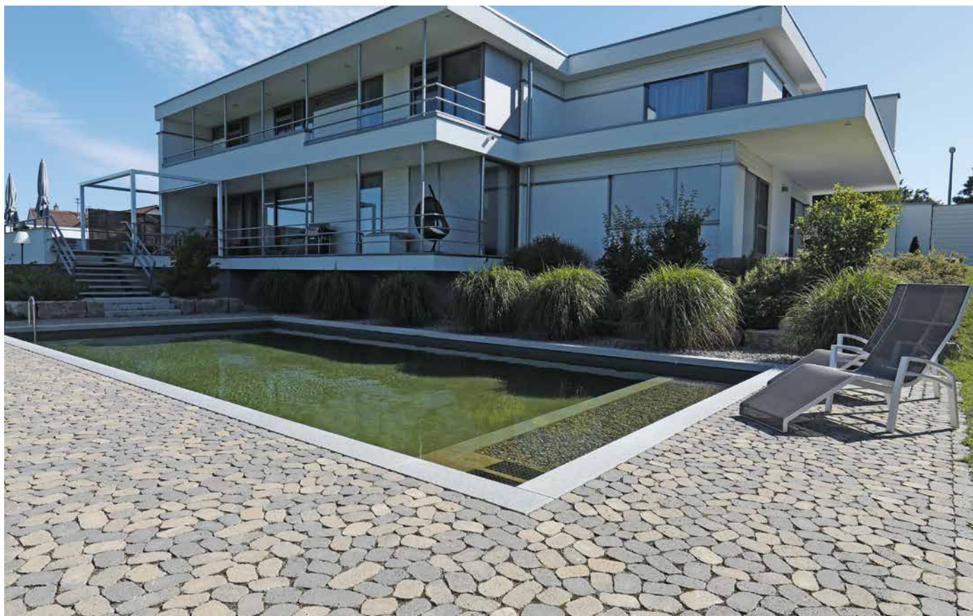
Richtungskontrast: Architektur gerichtet, Pflasterbelag ungerichtet.