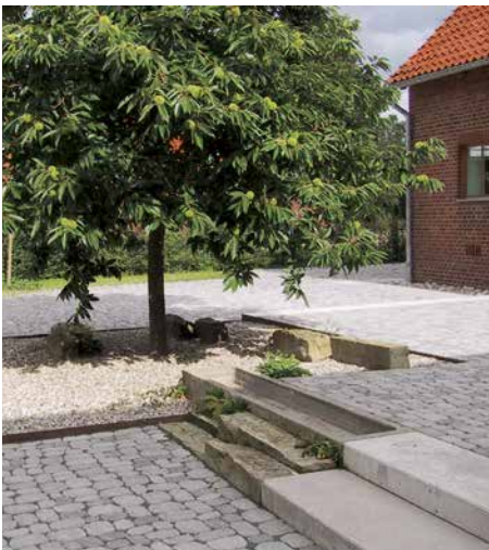
ARENA®: Auch seine ökologischen Qualitäten sind wegweisend.