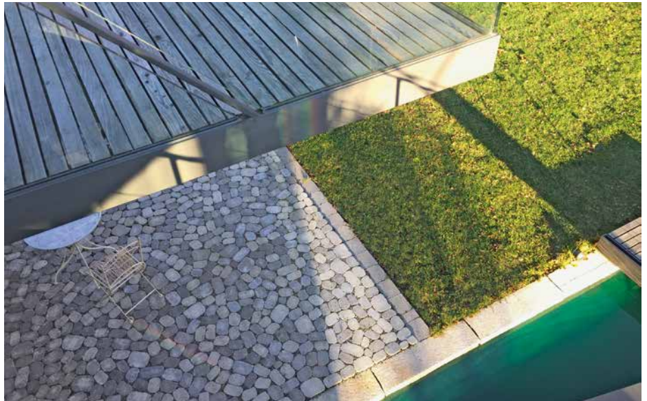
Oase: ARENA®-Pflastersteine sind das verbindende Element zwischen Wasser, Grün und Form.

Es muss gar nicht kompliziert sein. Keep it simple: Zen macht diese Einfachheit zum Prinzip. Mit Sorgfalt und Wertschätzung sind die Dinge platziert und die Gedanken ausgerichtet. Im Garten werden Wege, Plätze und Rückzugsorte mit Bedacht festgelegt. Das Ideal der Klarheit, Leere und Ausrichtung trieb die Gartengestalter bei diesem Projekt an. Dieser Garten strahlt eine leise Ordnung aus. Wie wird das erreicht? Orientierung entsteht durch Perspektive, Ruhe durch Sammlung. Der Fokus ist auf den Ort gerichtet, in dem der Mensch zur Ruhe finden kann. Der Blick wird geleitet durch linearperspektivische Elemente wie Hecken, Gräser, Schilf und führende Begrenzungselemente. Ruhe und Sammlung entstehen durch die bewusst gewählte ungerichtete Bodengestaltung mit dem ARENA®-Pflasterstein. Organische Steinformate mit ihren natürlich anmutenden Formen und der daraus entstehenden Lebendigkeit sind der Boden. Mensch und Natur sind im Fluss. Daraus ergeben sich vielfältige Kombinationsmöglichkeiten.